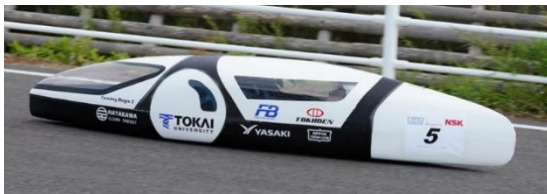
オープンクラス 3位、総合 3位 チーム東海大学ソーラーカーチーム