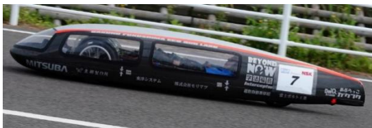
ジュニアクラス 2位、総合 6位 チーム学法福島高校