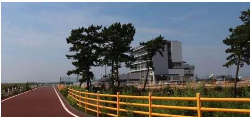
名取サイクルスポーツセンター

このエコラン競技大会は、喫緊の全地球的課題である地球温暖化防止の一助となるエネルギーの高効率利用技術と、次世代環境型自動車技術を究めるだけでなく、自動車産業で復興を目指す震災被災地東北において、自動車産業にかかわる人材の発掘と育成を目的とし、とくに、先端的次世代環境型自動車技術を体験できる意義ある大会です。