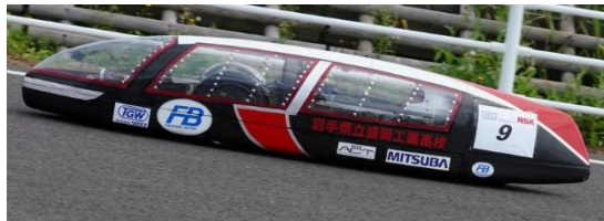
ジュニアクラス 1位、総合 5位 チーム盛岡工業高校自動車部