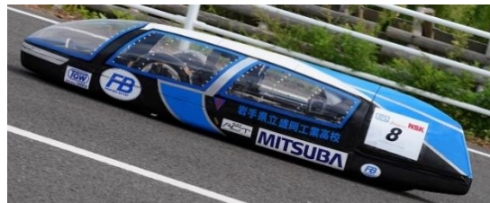
ジュニアクラス 3位、総合 7位 チーム盛岡工業高校自動車部