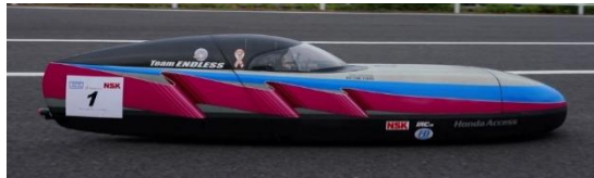
オープンクラス 2位、総合 2位 チーム ENDLESS