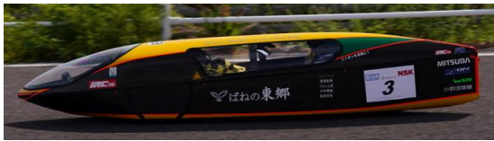
オープンクラス 1位、総合 1位 チーム東郷アヒルエコパレーシング