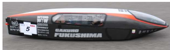
ジュニアクラス 1位、総合 3位 チーム学法福島 ERL