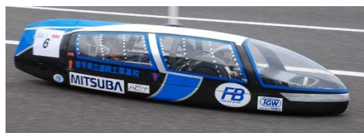
ジュニアクラス 2位、総合 5位 チーム岩手県立盛岡工業高校自動車部