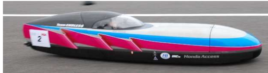
オープンクラス 2位、総合 2位 チーム ENDLESS