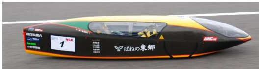
オープンクラス 1位、総合 1位 チーム東郷アヒルエコパレーシング