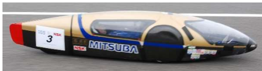
オープンクラス 3位、総合 4位 チーム“ヨイショット!” ミツバ