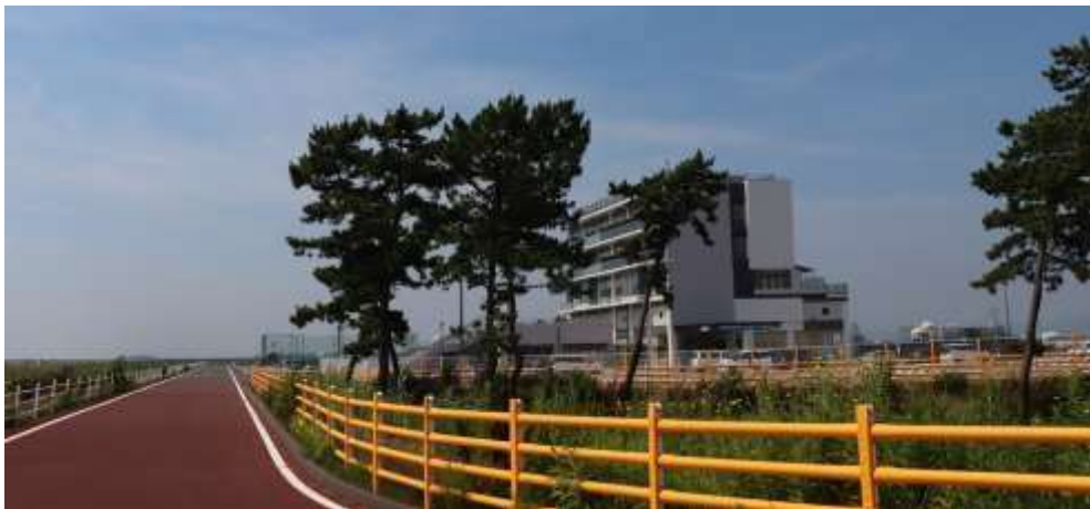
名取サイクルスポーツセンター

このエコラン競技大会は、喫緊の全地球的課題である地球温暖化防止の一助となるエネルギーの高効率利用技術と、次世代環境型自動車技術を究めるだけでなく、自動車産業で復興を目指す震災被災地東北において、自動車産業にかかわる人材の発掘と育成を目的とし、とくに、先端的次世代環境型自動車技術を体験できる意義ある大会です。